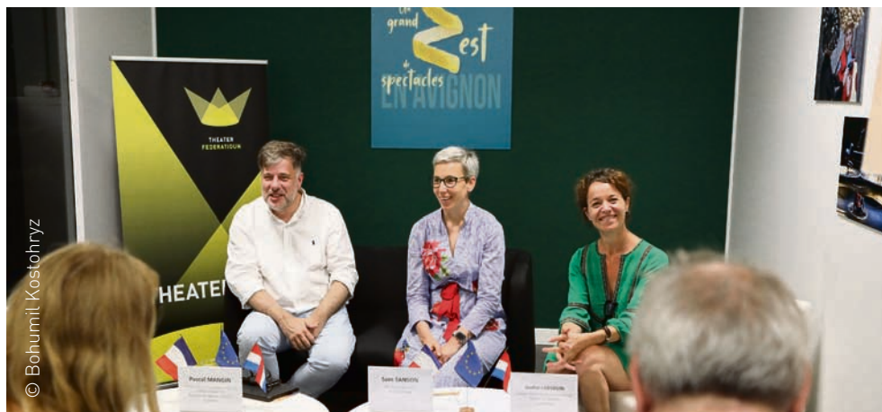
Festival OFF d'Avignon / Caserne des Pompiers / Conférence de presse