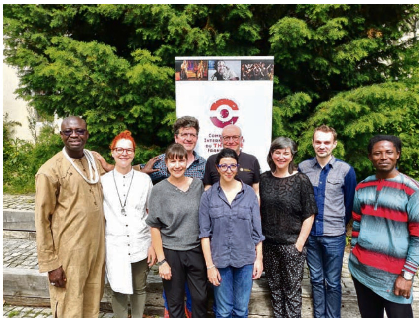
Assemblée Générale de la CITF à Monthey / Suisse