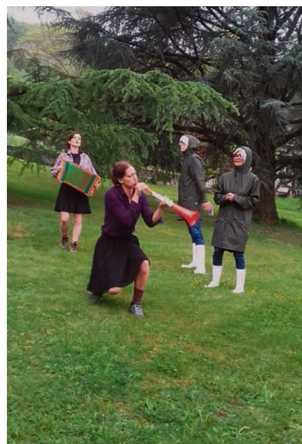
Pépinière à projets CITF à Monthey / Suisse